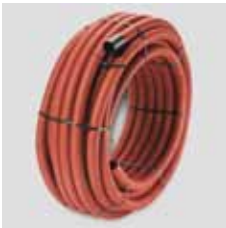
Kabelrør i ruller a 50 meter rød (r) eller orange (o)